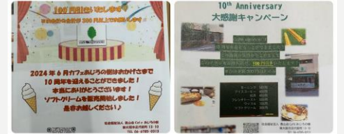
自法人のカフェの運営