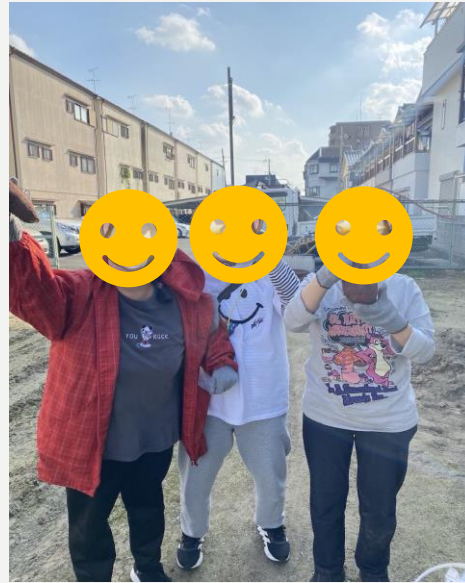
自法人の畑の運営