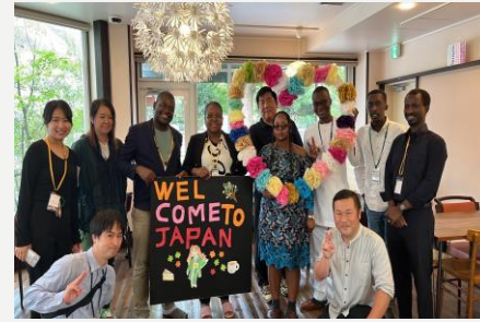
諸外国との交流イベント

外出イベントなど 各施設などによって 多岐にわたる さまざまな取り組みを しています。